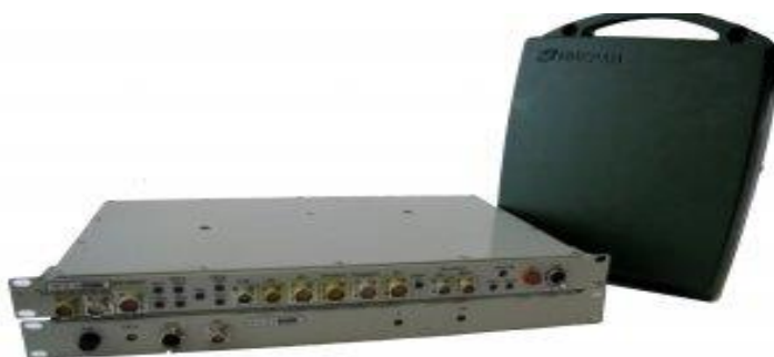
Рисунок 1 – Общий вид цифровой радиорелейной станции Р-429

Общий вид данной радиорелейной станции представлен на рисунке 1.